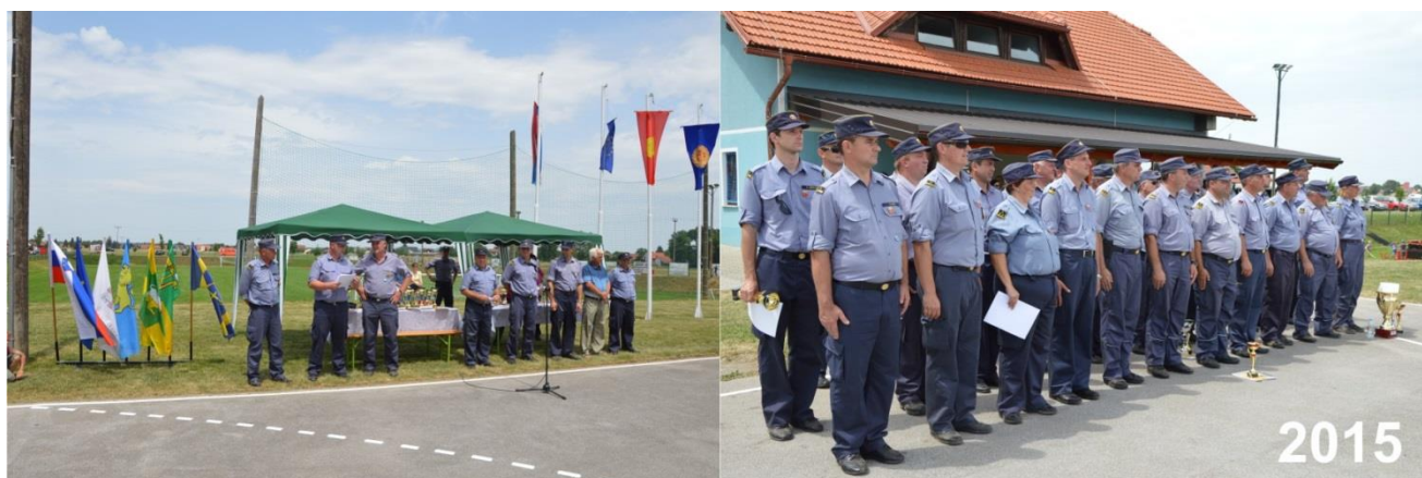
Slika 3: OGZ Ptuj redno vsako leto organizira tekmovanje zveze. Organizatorja izbere po predhodnem razpisu. Zveza ima 79 članski sodniški zbor. Na tekmovanju zveze pa se zbere do 60 sodnikov.