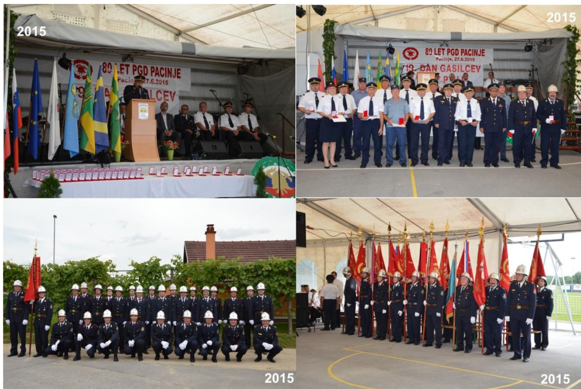
Slika 00: Na vse proslavah dneva gasilcev in praznovanj društev sta nas spremljala častni vod zveze, ki šteje 33 članov in ešalon 24. praporov.