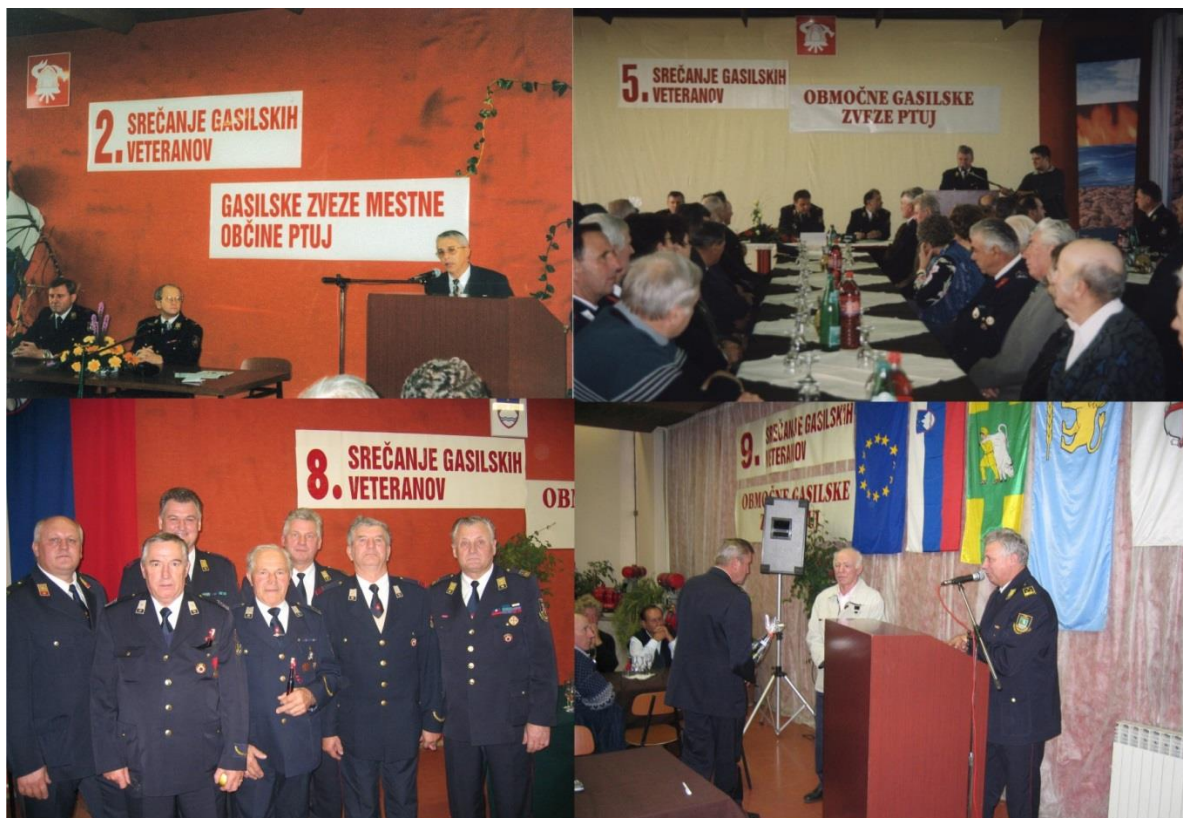
Slika 00: Prva srečanja so bila v Gasilskem domu Ptuj. Šele po letu 2006 smo se začeli srečevati po drugih lokacija.