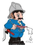
Slik 1: Logotip medobčinske gasilske lige ob 20 letnici delovanja v letu 2016